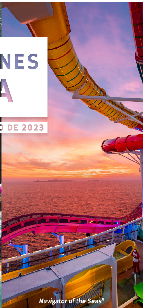
Navigator of the Seas®

30% DE DESCUENTO POR PASAJERO + NIÑOS NAVEGAN POR MENOS